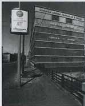
Gabriele Basilico, Via Ripamonti, 1980.

Tre mostre. Con volti, paesaggi e reportage