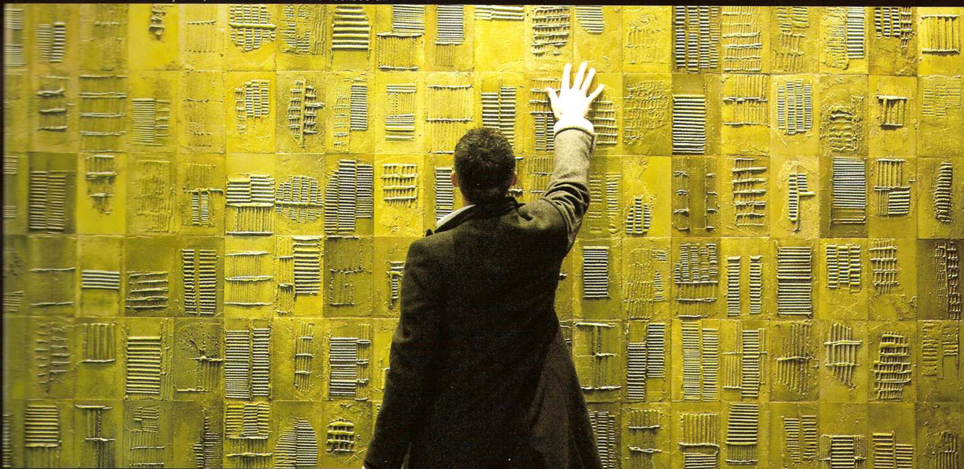
MORENO PANOZZO - Le Mie Impronte , mosaico monumentale 400x300 cm