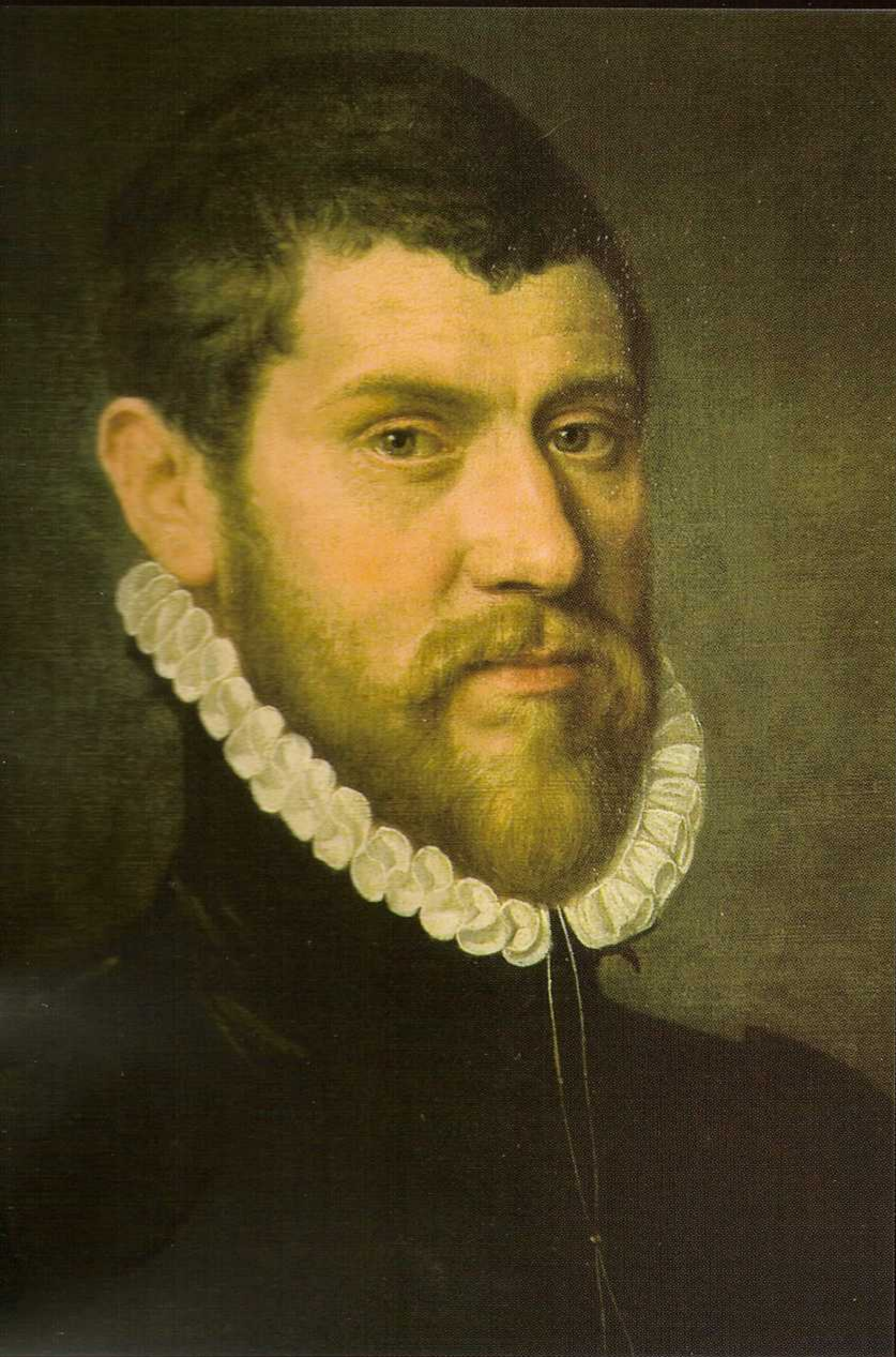
ADRIAEN THOMAS KEY - Ritratto di Gentiluomo , olio su tela, 73x58 cm